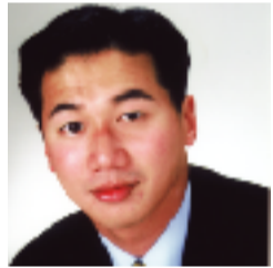
参議院議員 福山 哲郎

私が共に活動をしている参議院議員、府議会議員を紹介いたします。その他にも、多くの市町村会議員の方々と共に活動しています。