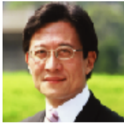
参議院議員 松井 孝治