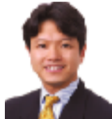
京都府議会議員 上村 崇 (京田辺市・綴喜郡)

2期目 文教常任委員会副委員長 民主党京都6区副総支部長 環境問題等に取組み、安心・安全の地域づくりをめざし、府政推進のために尽力していきます。