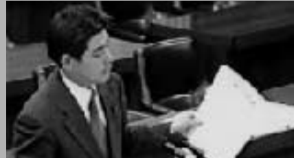
2月28日 衆議院予算委員会

北側一雄国土交通大臣からは、「実質的な地元住民の同意が必要」という答弁を、国土交通省の担当局長からは、「地元同意の内容を詳細に確認した上で判断する」との答弁を得ました。