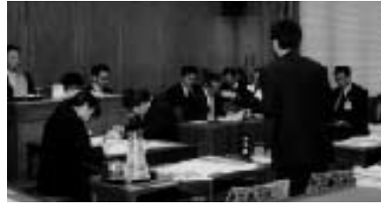
4月25日 衆議院決算行政監視委員会

厚生労働省から、「京都府から要望があれば、その方向で検討したい」という答弁を得ました。