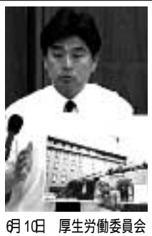
6月1日 厚生労働委員会

全国の年金関連施設を売却する法律が成立し、京田辺市にある「ウエルサンピア京都」(年金休暇センター)が、売却されることになりました。京田辺で唯一の大型宿泊施設であり、地元の農産物の販売も行われ、テニスコートやゲートボール場も大賑わいで、黒字の施設です。