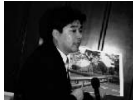
4月25日 衆議院決算行政監視委員会