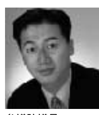
参議院議員 福山 哲郎