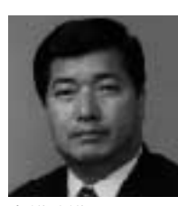
衆議院議員 玉置 一弥

先輩・同志の国会議員 京都の民主党のリーダー的存在。国会でも民主党の衆議院議員177人を束ねる代議士会会長。当選8回の実績から、厚生労働、財務、国土交通分野に強く、官庁の幹部に人脈が広い。京都南部の道路や都市基盤整備など、玉置議員と共に活動している。