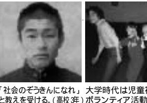
「社会のぞきんになれ」、大学時代は児童福祉施設でのボランティア活動に熱中し、(2001年)と教訓を受ける。(後援者)ボランティア活動に熱中し、(2001年)

座右の銘 「知りて行わばざるは、勇なきなり」 趣味 卓球、ネットの世話、プロ野球観戦(阪神ファン) 好きな俳優 高倉健 好物 漬物、梅干、ぎょうざ、たこ焼、抹茶、抹茶 自宅 京都府宇治市(妻と2人暮らし)