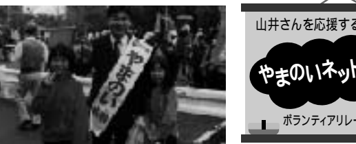
山井さんを応援するネットワーク やまのいネット掲示板 ボランティアリレーメッセージ