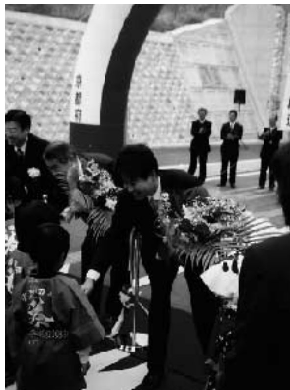
国道307号裏白バイパスの開通により、宇治田原と滋賀県の交通が大幅にスムーズになりました。開通式で地元のお子さん方から花束を受け取りました。

黄桷山手線の開通により、宇治市東部の交通渋滞が大幅に解消されます。さらに、地下鉄東西線も六地蔵駅まで開通し、京都市へのアクセスが向上しました。