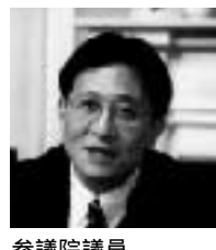
参議院議員 松井 孝治

官僚出身で、首相官邸に勤務した経験もあり、国会や官庁事情に詳しく、与党や財界にも幅広い人脈を持ち、行政改革や経済政策に関しては、民主党でも五本の指に入る論客。民主党の政調副会長。政権交代になくても、山井の存在であり、政権準備委員会事務局長。